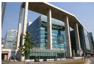
Arcs de Seine