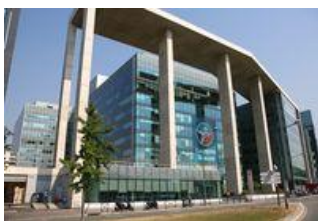
Arcs de Seine