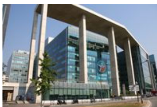
Arcs de Seine